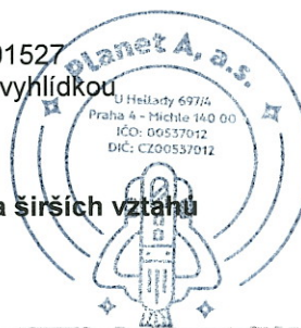
Polygon 1 - Mapa širších vztahů

Popis polygonu: stavba Náměstí Běchovice - Kaple s vyhlídkou